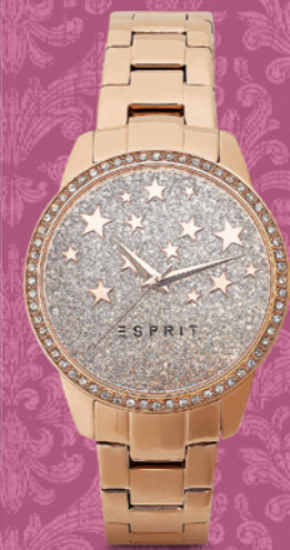
Schmuck, z. B. Esprit Damenuhr «TP10935 ROSE GOLD» mit Armband 169.-