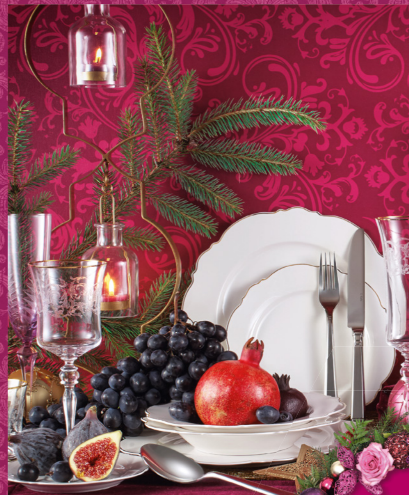
Geschirr, z. B. Teller flach 8.95