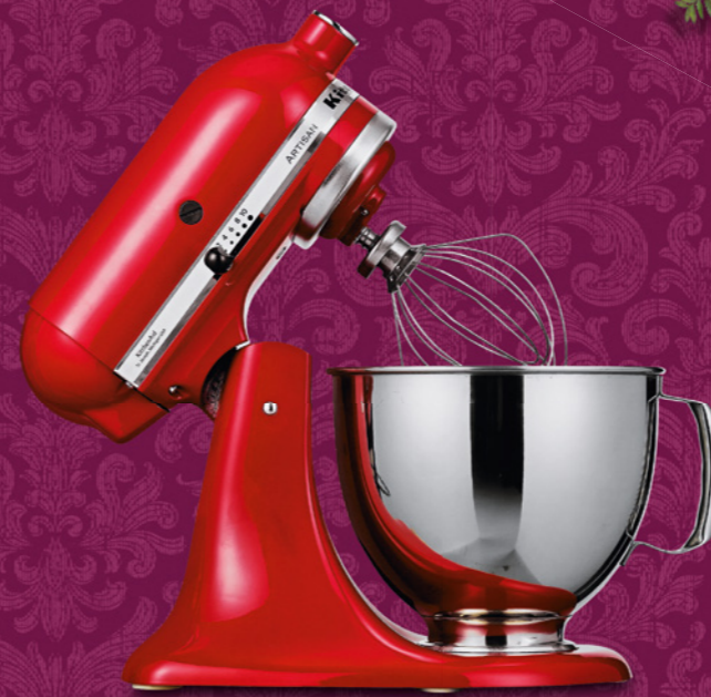
KitchenAid Küchenmaschine «Limited Edition Set», inkl. vRG, 2 Jahre Garantie 899.- statt 1499.-